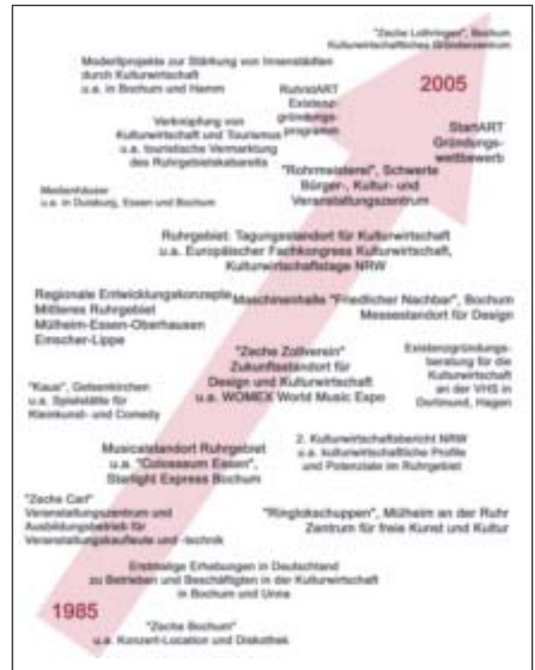
Abbildung 3: 20 Jahre Kulturwirtschaft im Ruhrgebiet: Eine Auswahl an Initiativen, Projekten, Studien, Programmen und Veranstaltungen