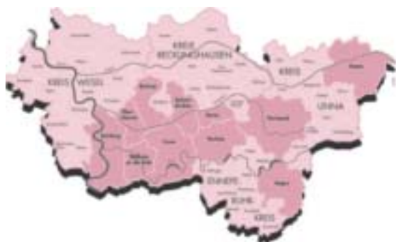
Abbildung 1: Kreisfreie Städte und Kreise im Gebiet des Regionalverbandes Ruhr