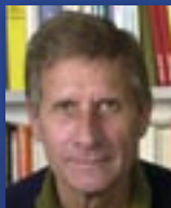
Schirmherr Tagesthemen- Moderator Ulrich Wickert