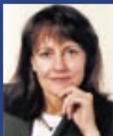
Schirmherrin Bundesministerin für Bildung und Forschung Edelgard Bulmahn

Vom 9. bis 11. Juli: Drei Tage lang zusammen mit 500 Jugendlichen in Essen und bei Warner Bros. Movie World