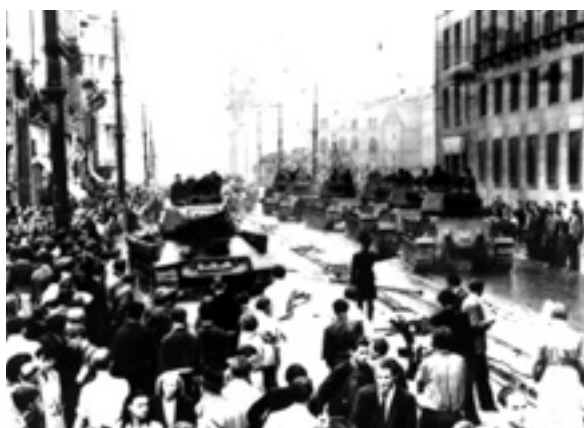
Berlin, Leipziger Straße: Russische Panzer vor dem Haus der DDR-Ministerien, heute Bundesfinanzministerium.