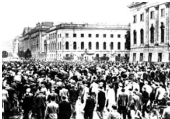
Berlin, Unter den Linden