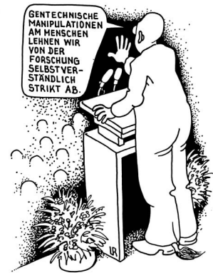
Karikatur: Reinhold Löffler

Auch in den USA ist es zulässig, auf diese Weise menschliche Zellen zu gewinnen. In Deutschland ist der Widerstand gegen diese Methode gegenwärtig noch so groß, dass sie verboten ist.