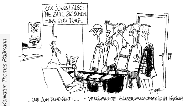
Karikatur: Thomas Pfeibmann

→ Wie wird nach Darstellung des Zeichners über die Einberufung entschieden? Was will er kritisieren?